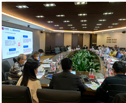
华发股份常态化召开安全生产会议及开展安全生产培训