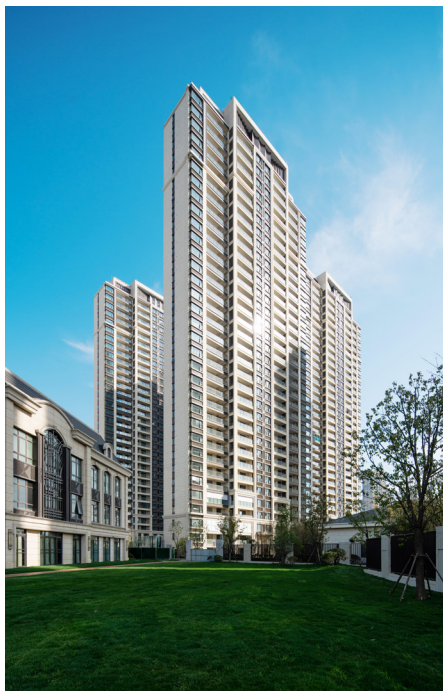
无锡华发首府获全国首批健康社区

—— 绿色设计 。华发股份致力于“微海绵”社区建设，打造生态舒适环境。在未来系·城市系项目归家园路铺装中采用透水材料；在四季系·府系结合次要景观区设置雨水花园、下凹绿地等绿色雨水基础设施，通过增强入渗、回用等措施保证积水时间不超过24小时，打造了及珠海华发新城、珠海横琴华发首府、上海华发华润静安府、金湾华发商都等一系列绿色标杆项目。