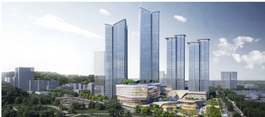
珠海城市之心效果图