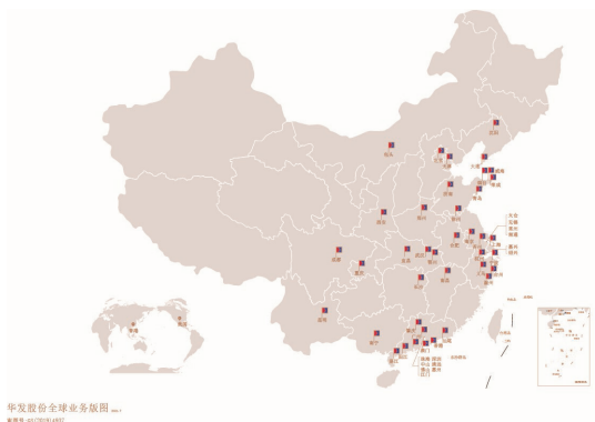
华发股份业务布局图

珠海华发实业股份有限公司是华发集团旗下房产开发上市公司，《财富》中国500强企业、中国房地产百强企业第32位。