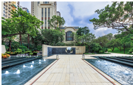
广州华发中央公园获健康建筑三星级认证

—— 绿色施工 。华发股份积极创造绿色文明施工形象，落实噪声防治措施、“三废”治理、降低能源消耗，积极开展工程项目文明施工专项检查。同时，综合考虑建设项目可能对环境产生的影响，开展环境影响评估；运用生态补水技术，对项目所在水源进行水质预处理，构建水环境生物链，对水中的污染物进行水质净化；运用生态堤岸技术，通过植物生态入水，打造出丰富多样的生态堤岸。