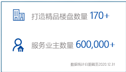
楼盘数量及业务数量

华发坚持以客户为中心，打通客户服务“最后一公里”，推行物业和客服联合办公，不断完善客户服务管理体系，打造从前介服务，到分户查验，到案场服务，到项目管理和多元经营的“全生命周期”服务体系。不断提高物业服务能力，及时改进产品和服务质量，全面提升客户满意度，将极致服务的理念融入各项工作细节，致力于为客户提供360°全优的华发式美好生活体验。